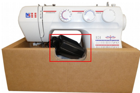
Abbildung 1: Transportunterteil