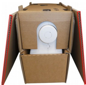
Abbildung 4: Transportenteil mit aufgesetztem Transportoberteil